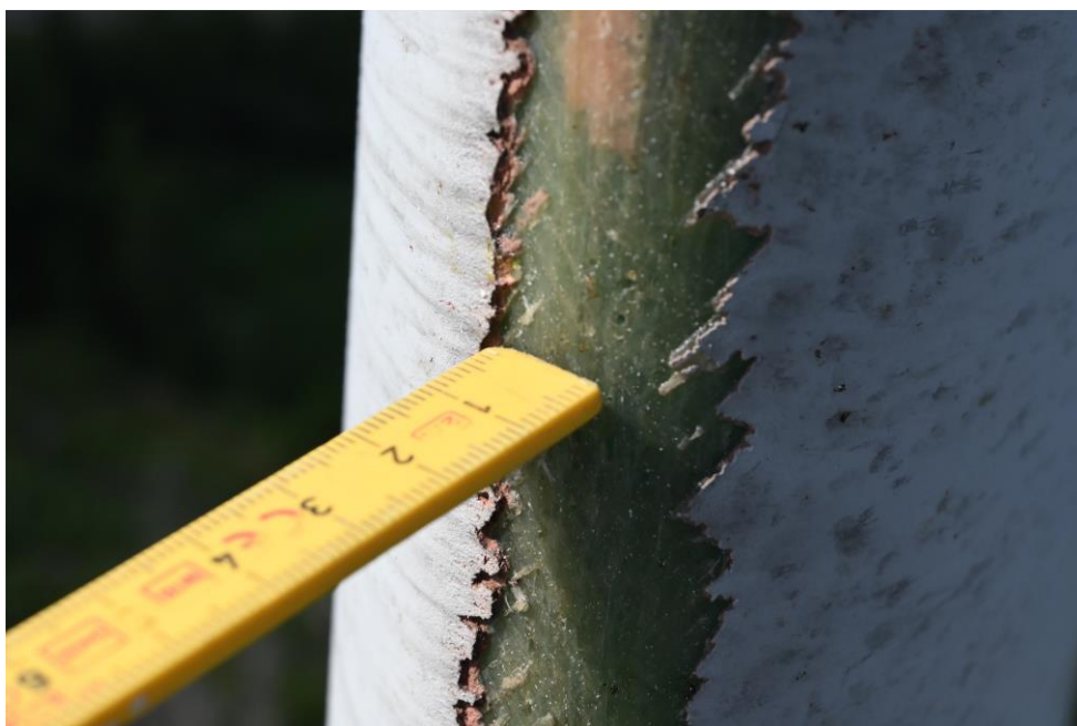
Figur 3 Kanterosjon på et rotorblad i Norge

skadene gjennom bedre styring av drift, valg av seigere og mer elastisk overflatebelegg, og enklere og raskere reparasjonsteknologi.